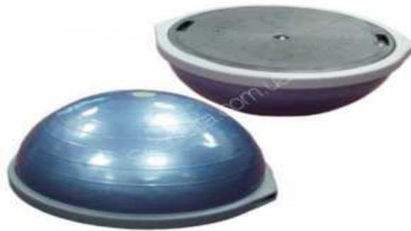
Рис. 2.3. Балансувальна платформа БОСУ

У діаграмах наочно відбивають й аналізують масові дані. У курсових роботах найчастіше використовують стовпчикові діаграми (площинні й об'ємні). На стовпчикових діаграмах дані зображуються у вигляді прямокутників (стовпчиків) однакової ширини, розміщених вертикально або горизонтально. Наприклад: