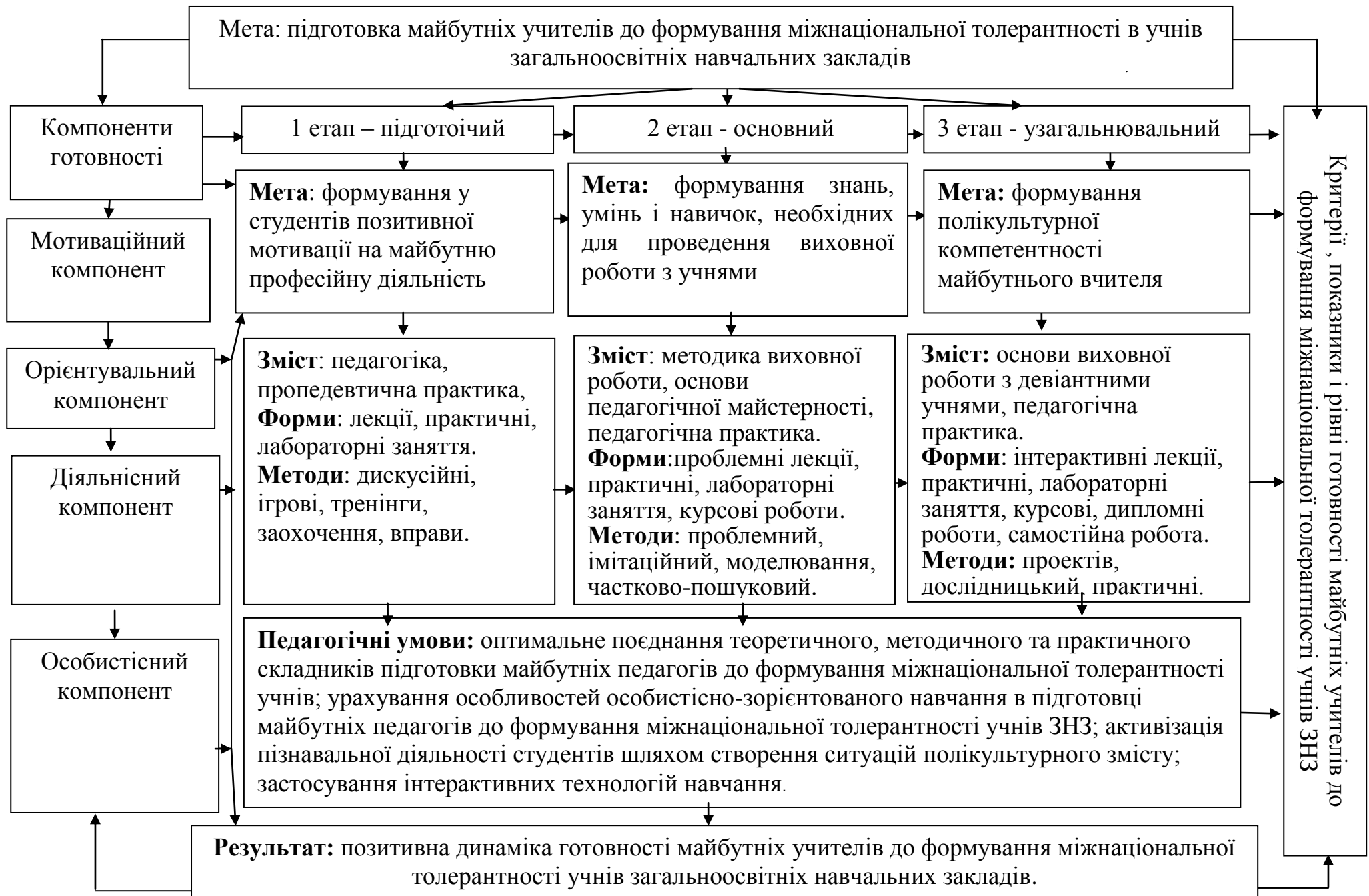
Рис. 1. Модель підготовки майбутніх учителів до формування міжнаціональної толерантності учнів