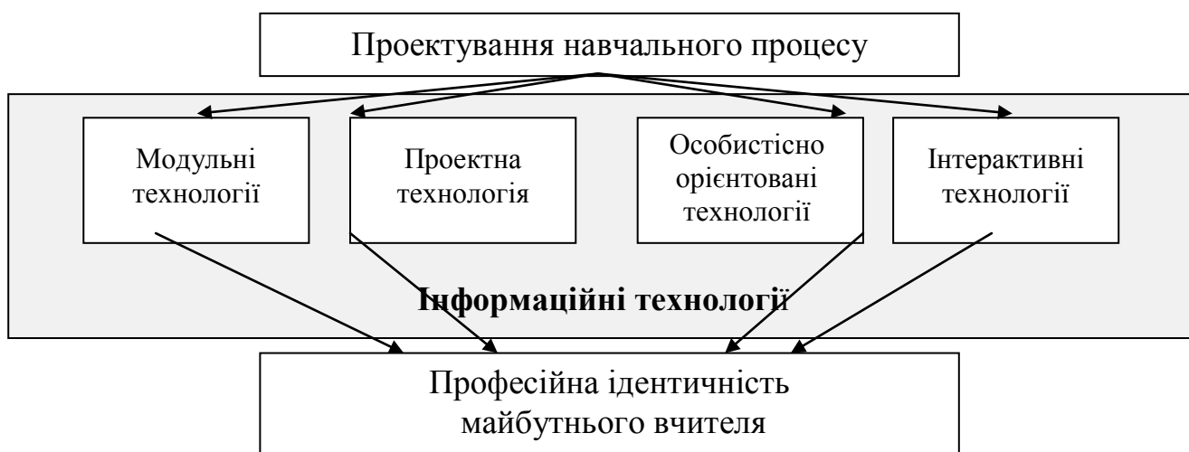
Рис. 1. Взаємозв'язок між професійною ідентичністю та проектуванням навчального процесу

Розглядаючи взаємозв'язок проектування й педагогічних технологій, зробили спробу об'єднати їх єдиною схемою з виходом на професійну ідентичність (рис. 1)