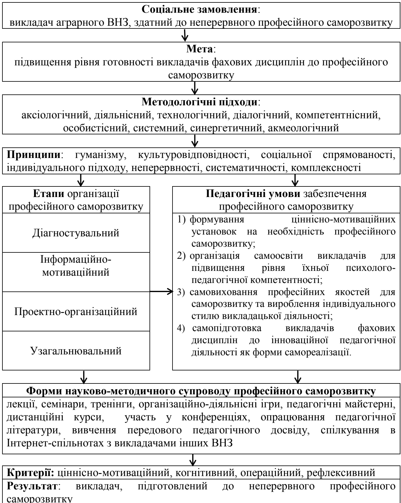
Рис. 2. Модель роботи аграрного ВНЗ щодо сприяння професійному саморозвитку викладачів фахових дисциплін

Робота аграрного ВНЗ щодо сприяння професійному саморозвитку викладачів фахових дисциплін здійснювалась у чотири етапи: